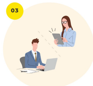
03 初めてでも安心！ 導入運営サポート